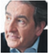
JAUME BARTUMEU CASSANY

President de Socialdemocràcia i Progrés d'Andorra